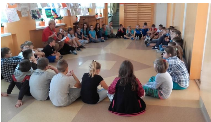
Zajęcia socjoterapeutyczne w dwóch grupach wiekowych

Uczniowie podczas tych zajęć wypracowali kodeks prawidłowych zachowań i skuteczne sposoby radzenia sobie z przejawami przemocy i agresji.